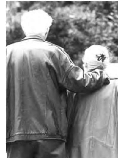
A cura di Patrizia Penna

Altra regola importante è quella di evitare di toccarsi il naso, la bocca e gli occhi con le mani e ricordarsi quando si starnutisce o si tossisce di coprire naso e bocca con il gomito piegato o con un fazzoletto di carta, gettandolo poi immediatamente nei rifiuti.