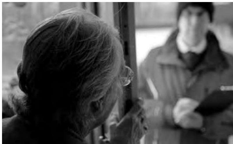
sta effettuando operazioni di questo tipo senza preavviso.

“Fidarsi solo delle fonti istituzionali e fare riferimento solo a quelle ufficiali”