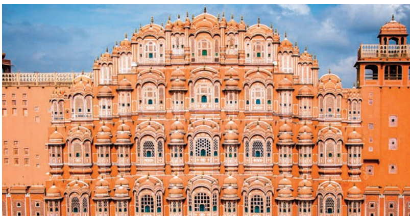
Hawa Mahal, Jaipur, India.

è un importante punto di riferimento storico e architettonico situato a Jaipur, la capitale dello stato indiano del Rajasthan. Fu costruito nel 1799 con lo scopo principale di permettere alle dame reali di osservare la vita quotidiana e le feste nella strada sottostante senza essere viste. Oggi una testimonianza della ricchezza storica e culturale della 'Città Rosa' di Jaipur, così chiamata per l'uso predominante