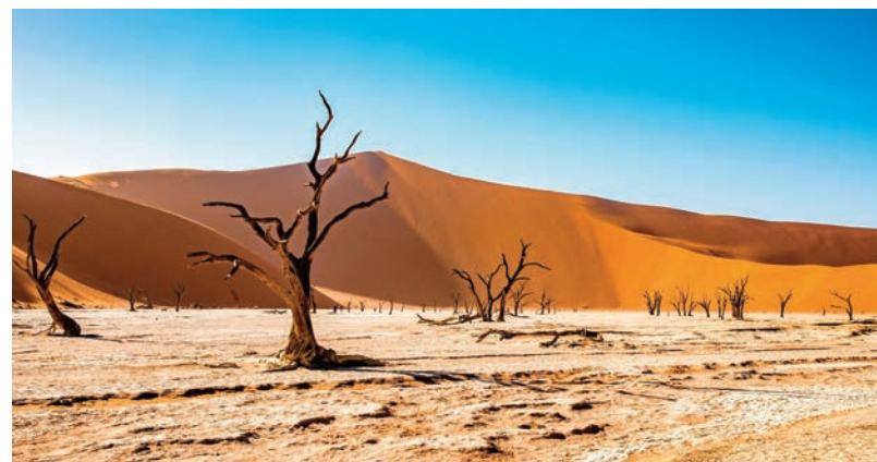
Deadvlei, Namibia.

"Il nostro ultimo report sulle tendenze di viaggio ha rivelato che l'esplorazione culturale è una priorità assoluta per i viaggiatori che partiranno nel 2024 e quale modo migliore di immergersi in una cultura completamente diversa che scegliere di esplorare una nuova destinazione! Il colore di quest'anno evoca immagini di tramonti, architetture mozzafiato e paesaggi da sogno, e sarà sicuramente in grado di ispirare la voglia di viaggiare di coloro che stanno pianificando la loro prossima avventura", spiega Maglietta.